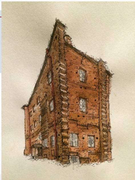
auteur du dessin : Alina Chanina

Dans la cour de l'Université d'État de Saint-Petersbourg se trouve un bâtiment en briques appelé « Jeu de paume ». C'est le premier bâtiment en Russie conçu exprès pour la pratique des sports. Sa construction a débuté dans la seconde moitié du XVIIIe siècle.