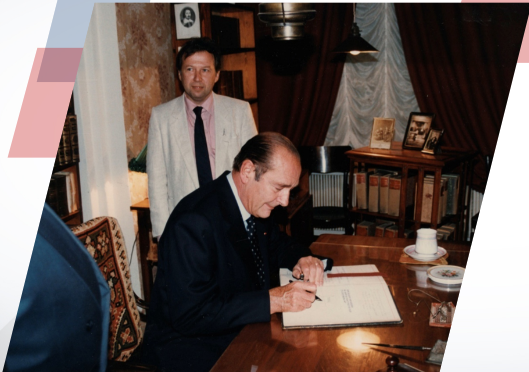
1997 - Visite du président de la République Française Jacques Chirac Musée-Archives Dmitri Mendeleïev.